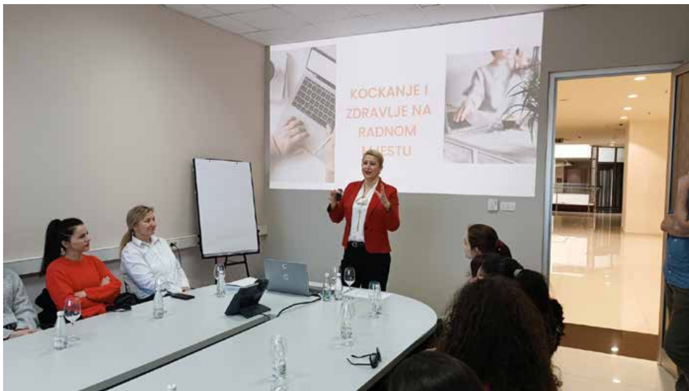
Primjer br. 2: Edukacija na temu DOP, Mostar, feb. 2023.