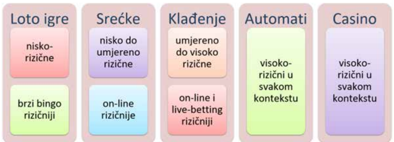
Primjer br 1: materijal sa edukacije za radnike LBiH